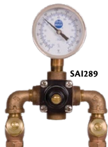
Point de réglage ajustable à l'intérieur de la gamme par une vis de pression à clé hexagonale

Arrêts de vérification avec grille intégrée sur les arrêts d'eau